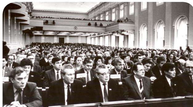
Делегаты Учредительного Всероссийского съезда профсоюзов, 1990 г.

Опираясь и творчески развивая проверенные историей традиции профсоюзного движения, профессиональные союзы России адекватно откликнулись на вызов времени. В период 1989-1992 годов шел активный процесс образования российских профсоюзов как самостоятельных структур и выхода их из-под партийной опеки. В сентябре 1989 года IV пленум ВЦСПС принял решение о создании Российского совета профсоюзов.