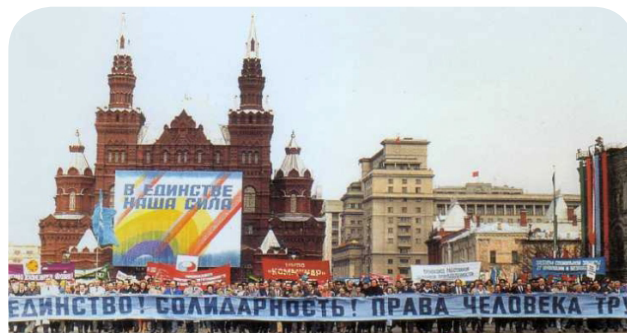
Первомайская профсоюзная манифестация на Красной площади, 1990 г.