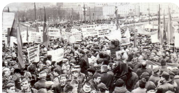
Всероссийская акция профсоюзов «Нет - губительным экономическим реформам!», 1998 г.

Вместе с тем, предпринимаемые властью шаги ФНПР оценила как неудовлетворительные. Так, не были возвращены долги по зарплате и продолжались попытки изменить трудовое законодательство в направлении сокращения и ограничения прав наемных работников и профсоюзов. Именно с учетом этих негативных факторов в экономике Исполком ФНПР принял решение провести 9 апреля Всероссийскую акцию профсоюзов «За полную выплату заработной платы». В этих массовых коллективных действиях участвовали более 14 миллионов человек. Приостановки работы и забастовки прошли на 12 тысяч организациях с числом участников