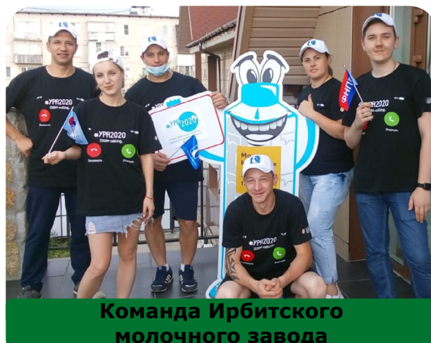
Команда Ирбитского молочного завода

Три дня активной, плодотворной работы не прошли бесследно, получен опыт работы, который позволит молодежи двигаться вперед. Ребята внесли достойный вклад в общее дело по распространению информации о необходимости профсоюзного продвижения. Молодежь завода записала видеоролик-экскурсию по рабочим местам, рабочую песню, в подготовке которых приняла активное участие председатель первичной профсоюз-