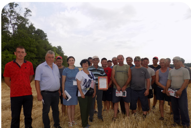
Работники ООО «Колхоз 50 лет Октября»

это лучший регион, здесь собрано 11,7 млн тонн зерна. На уборке счет идет на минуты. Традиционное профсоюзное мероприятие - чествование передовиков состоялось в Зеленоградском, Кагальницком, Каменском, Мясниковском, Неклиновском и Тарасовском районах.