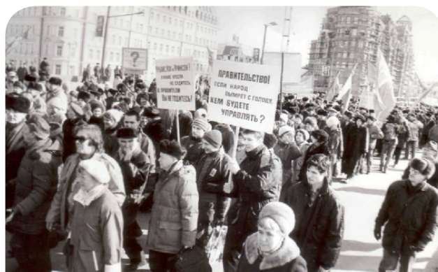
Митинг на Горбачевом мосту перед зданием Правительства РФ, 1993 г.

В мае Пленум Совета ФНПР принял постановление «О конституционной реформе