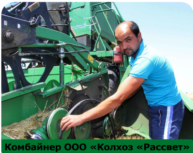
Комбайнер ООО «Колхоз «Рассвет»